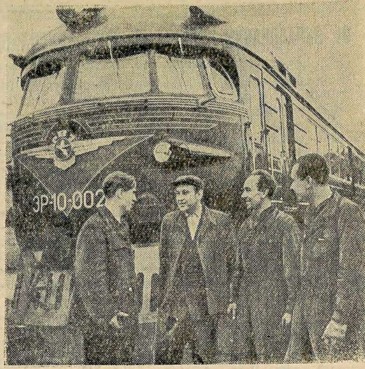
На Рижском вагоностроительном заводе выпущены моторно-головные вагоны нового электропоезда ЭР-10. Длина каждого вагона 24,5 метра — на 5,5 метра больше ныне выпускаемых. Поезд предназначен для высоких пассажирских платформ.

На этом Пленум ЦК КПСС закончил свою работу.