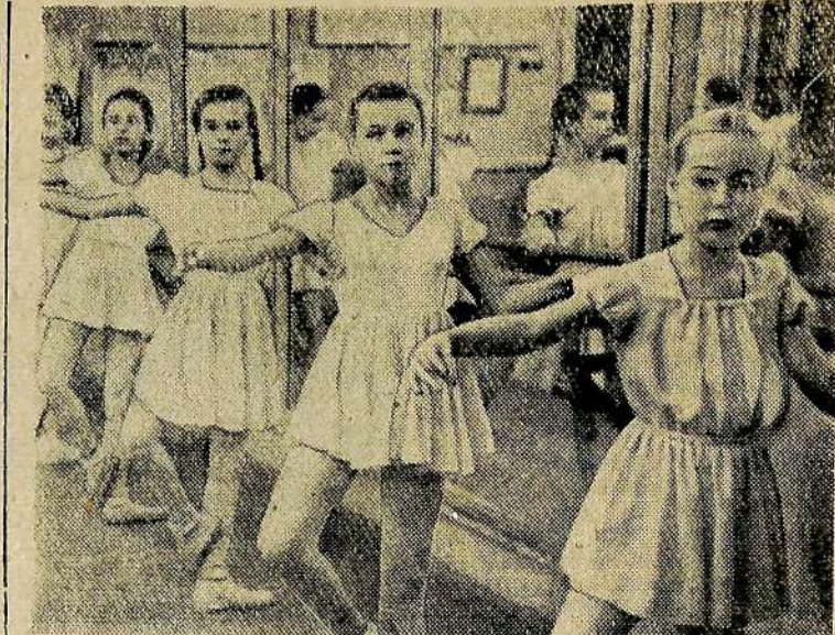
Занятие учащихся студии по классическому танцу Дворца культуры Ленинского района города Саратова.