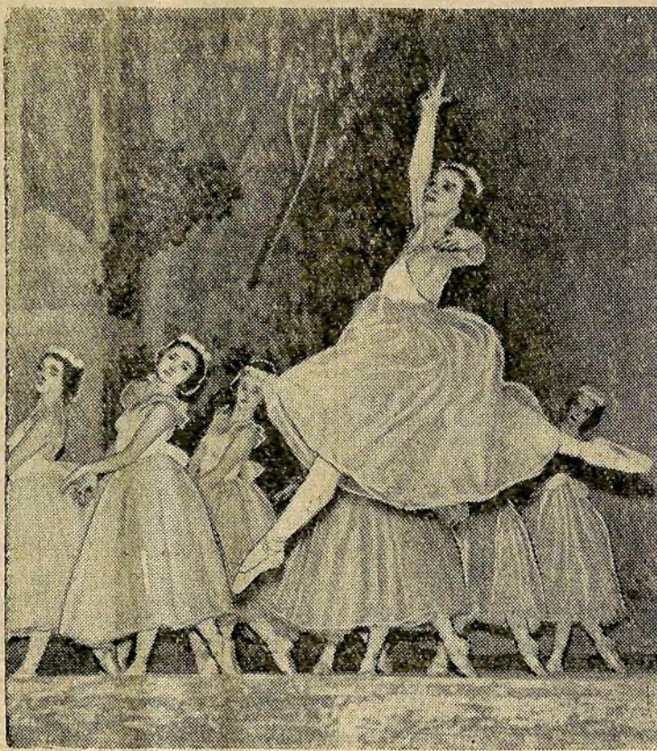
В Саратовском театре оперы и балета состоялся новый спектакль — балет французского композитора А. Адана «Жизель». На снимке: сцена из спектакля «Жизель».