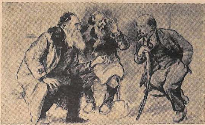
Рисунок художника Н. Н. Жукова «Разговор по душам».