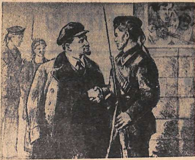
Рисунок художника Н. Н. Жукова «Спасибо матросам!». Фотохроника ТАСС