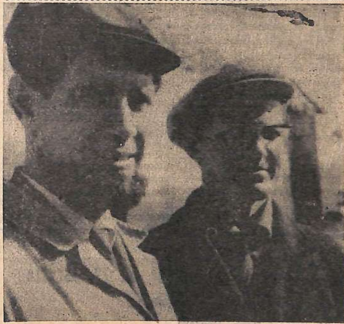
Строители седьмой Волжской. Сколько дел на их счету! Сколько вынуто грунта, уложено бетона, смонтировано армоконструкций — трудно сосчитать.