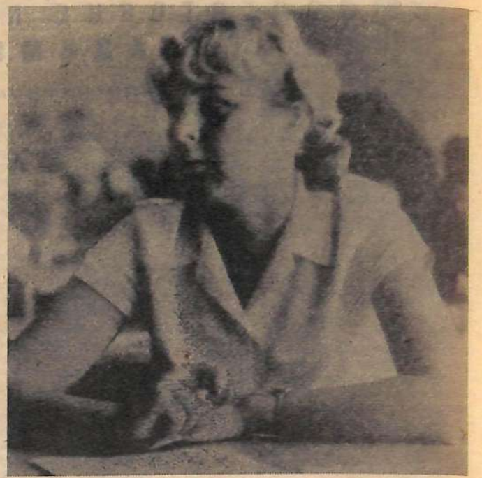
На приемных экзаменах.