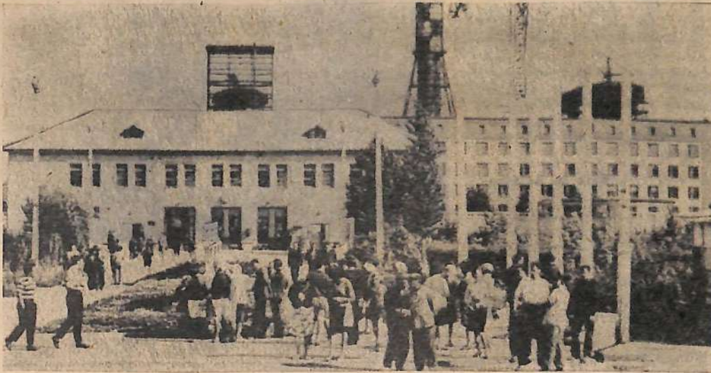
Комбинат химического волокна. У проходной.

«Культура производства» — так названа передовая статья заводской газеты «Машиностроитель». В ней говорится: