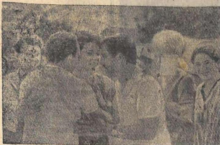
На снимке: советская делегация в столице Болгарии. Встреча давних друзей.