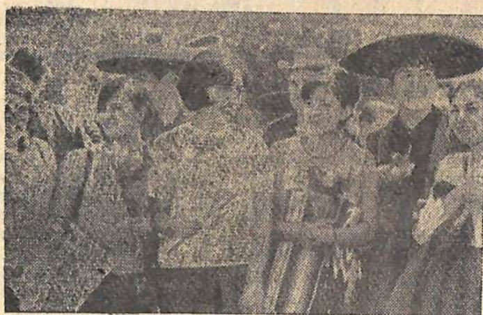
На снимке: посланцы молодежи стран Латинской Америки в столице фестиваля.