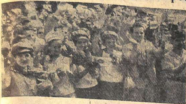
На снимке: советская делегация в столице фестиваля.