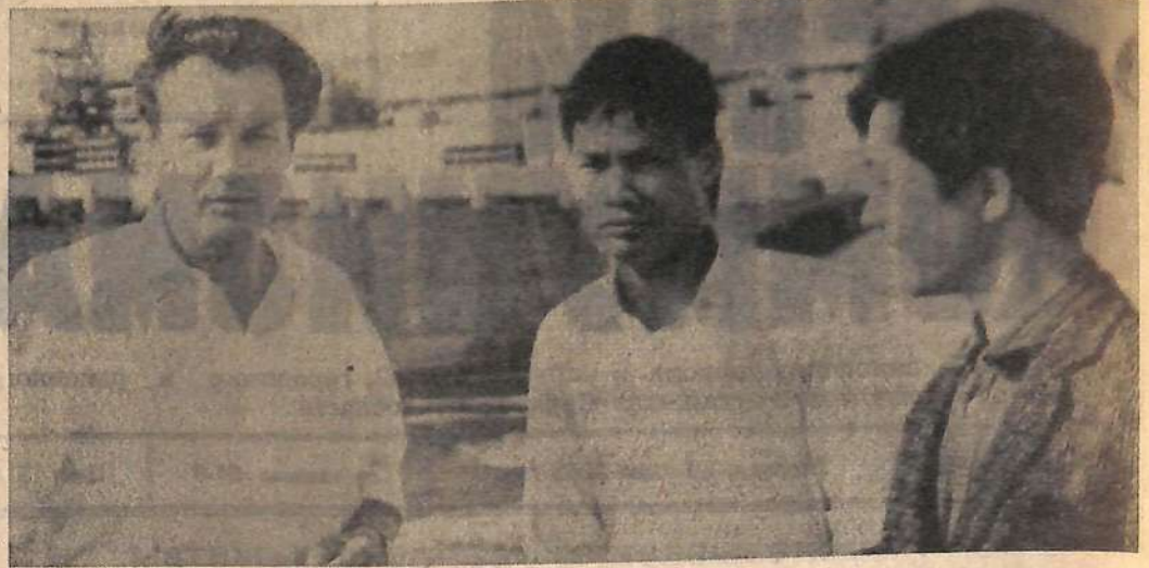
Для прохождения практики на ГЭС в наш город прибыли молодые вьетнамцы, студенты Ленинградского политехнического института. Их особенно интересуют работы по монтажу турбин.