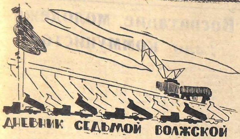
ДНЕВНИК СЕДЬМОЙ ВОЛЖСКОЙ

На трудовом календаре гидростроителей начало второго полугодия. Всего за шесть месяцев на объектах строящейся ГЭС и химии предстоит освоить более двадцати миллионов рублей.