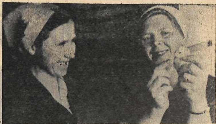
Коллектив межколхозной птицефабрики в нынешнем сезоне успешно справляется с плановыми заданиями по увели-

ПРЕЗИДИУМ ВЕРХОВНОГО СОВЕТА СССР СОВЕТ МИНИСТРОВ СССР