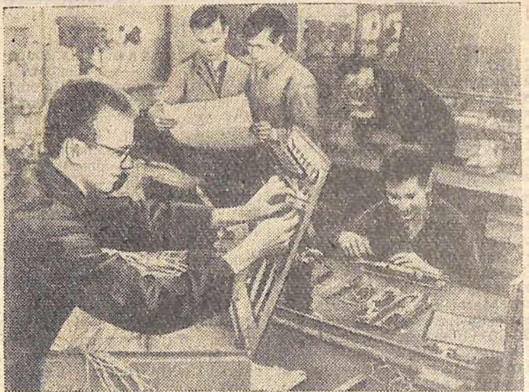
ГДР. Профессиональное обучение в стране является составной частью единой социалистической системы образования. Повышение уровня профессиональных знаний достигается введением новых предметов и дальнейшим совершенствованием форм и методов обучения.