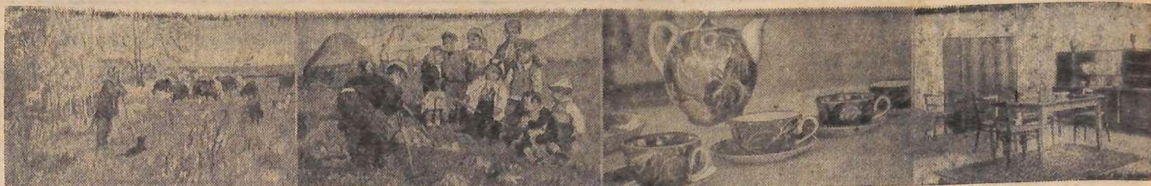
«Художники — народу» — художественной лотереи, такая выставка открыта в Москве. Демонстрируются выигранные третьей Всесоюзной лотереи произведения художников. На снимках: картина народного художника СССР, лауреата Ленинской премии А. А.