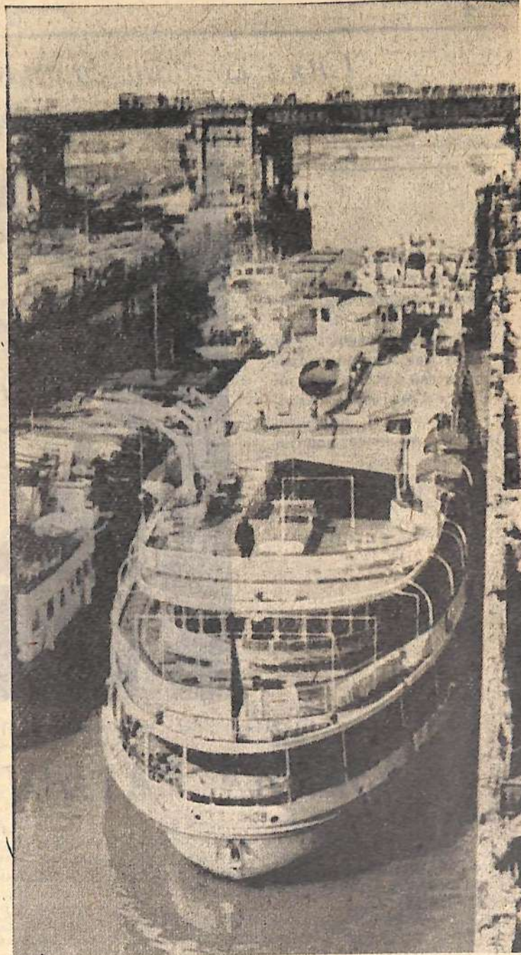
Огромные речные лайнеры приплывают по голубой улице Балакова. На снимке

Тревога руководителей монтажной и наладочной организации понятна: всего несколько миллиметров отделяют огромную 500-тонную вращающуюся машину ротора от обмоток статора. Достаточно малейшей непредвиденной случайности — и может случиться трудно поправимая ошибка. Вот почему так ответственным момент первых оборотов ротора, имеющего колоссальную энергию.