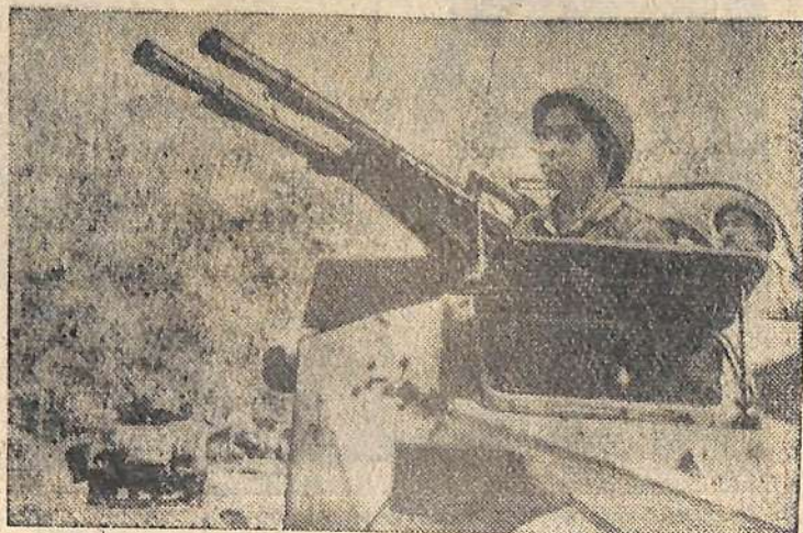
Демократическая Республика Вьетнам. Передвижные зенитные установки Вьетнамской народной армии.