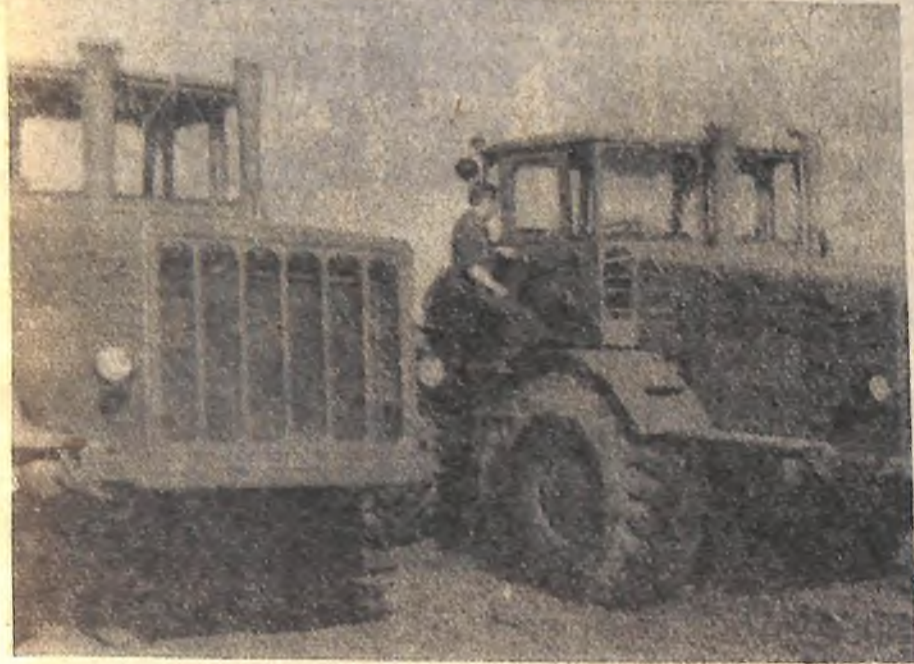
Из года в год растет неделимый фонд в сельхозартели имени Куйбышева. Только в этом году хозяйство приобрело несколько тракторов, тридцать новых узкорядных сеялок, много другой прицепной техники. На снимке: новые тракторы К-700.