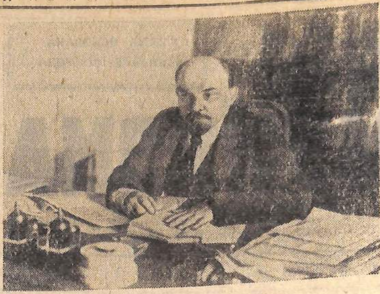
В. И. Ленин в своем кабинете в Кремле 16 октября 1918 года.

С начала этого учебного года совет комнаты приступил к проведению так называемых открытых экскурсий по улице имени В. И. Ленина, на Саратовскую ГЭС, к историко-революционным памятникам. Для проведения их подготовлена специальная группа экскурсо-