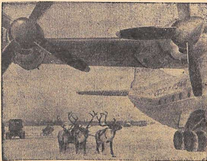
Таежный перекресток.