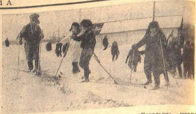
Военизированной игра «Зарница». «Батальон» школы № 12 на марше.