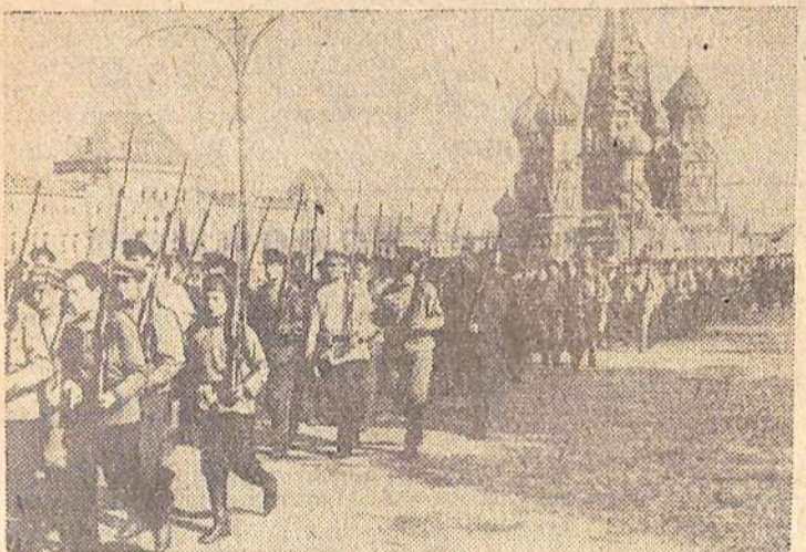
Парад Всевобуча в Москве (1919 год).