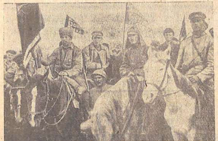
Бойцы 1-й Конной армии на митинге. 1920 год.

Среди гражданских профессий, которые становятся очень нужными в военное время, специальность медика будет едва ли не первой. Будь то врач, фельдшер, медсестра. Но вряд ли кто из обладателей этих профессий когда-либо думал, что ему придется приобретать навыки работы не в белоснежных палатах, амбулаториях, а в тяжелых фронтовых условиях.