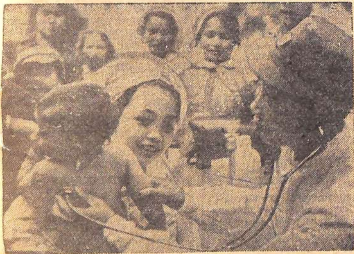
Демократическая Республика Вьетнам. Врачи пограничных застав в провинции Нгеань оказывают регулярную медицинскую помощь населению близлежащих районов.

На снимке: военный врач проверяет здоровье ребенка. Фото ВИА — ТАСС.