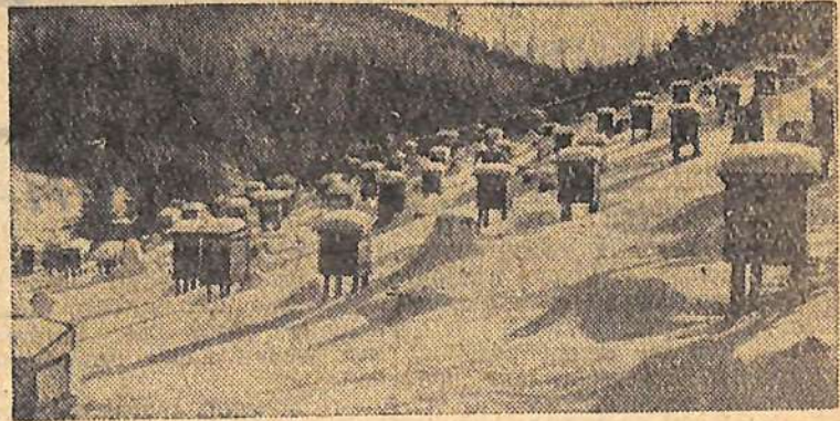
Закарпатская область. Пасека Ясинского лесокombината «Радянскі Карпати» дала нынче большой урожай. От каждой пчелосемьи получено почти 19 килограммов товарного меда. На снимке: «пчелиная зимовка» в урочище Должана. Фото Л. Ковгана. Фотохроника ТАСС.

Правление колхоза, партийная организация, труженики ферм живут одной заботой — организованно провести зимовку, досрочно выполнить пятилетний план. Над решением этих больших задач и работает весь коллектив хозяйства.