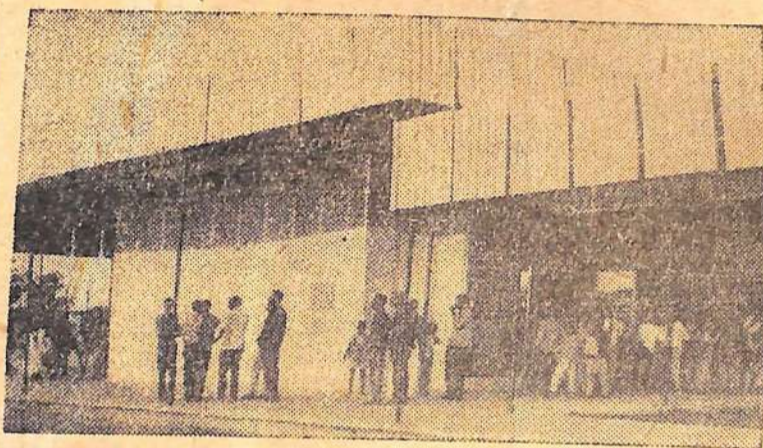
Мали. Сельскохозяйственный институт в местечке Катибугу близ города Куликоро — результат плодотворного малийского и советского сотрудничества.