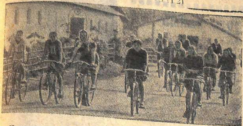
Черновницкая область. В личном пользовании колхозников ордена Трудового Красного Знамени артели имени Ленина — автомашины, множество мотоциклов и велосипедов. На снимке: домой после работы на ферме.