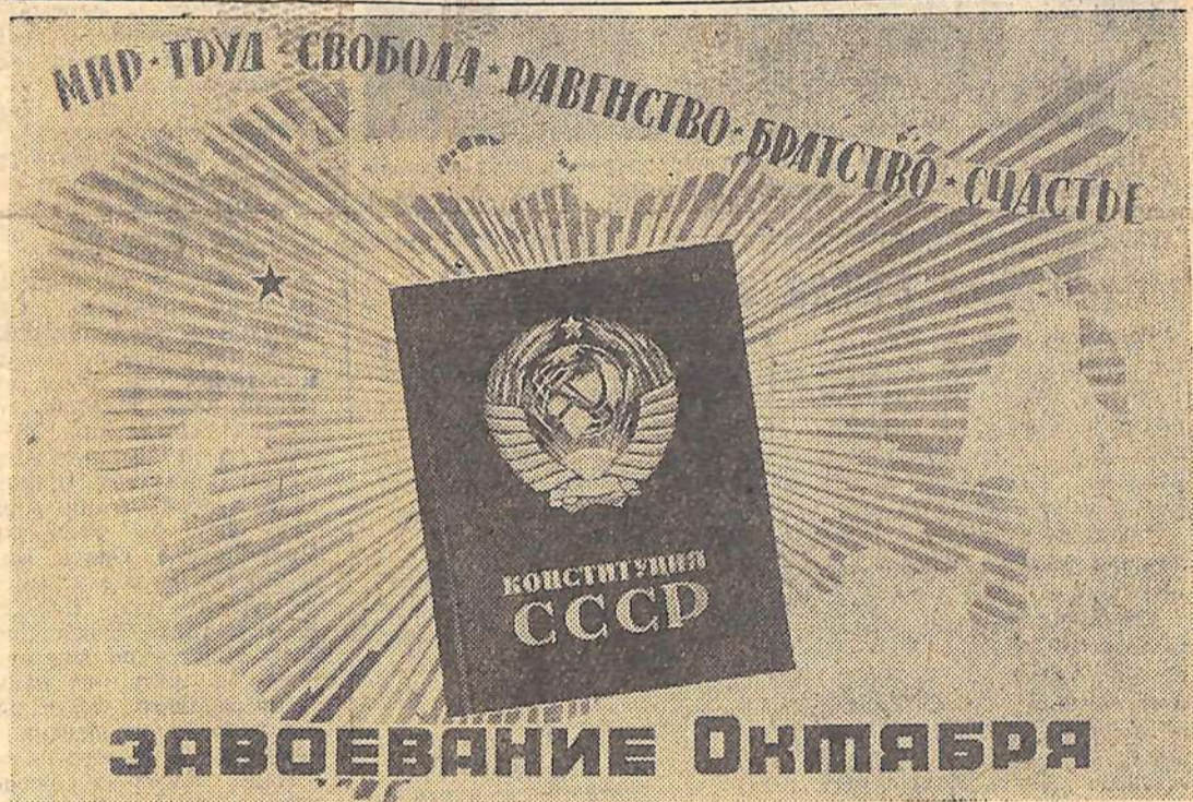
Плакат художника В. Викторова. (Издательство «Советский художник»).

За сутки к фермам подвозится около 1000 центнеров кормов.