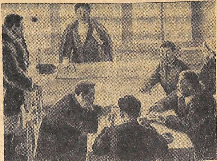
Открыта в Москве Всесоюзная юбилейная художественная выставка привлекает много посетителей. На ней представлено свыше 2.000 картин, скульптур, графических листов и монументальных композиций, созданных художниками всех 15 союзных республик. Произведения воскрешают славы страницы истории Советского государства, показывают сегодняшний день нашей страны.