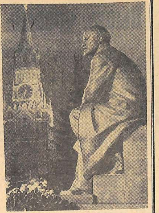
Москва. Памятник В. И. Ленину в Кремле, торжественно открытый 2 ноября 1967 года.