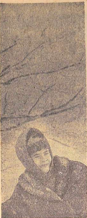
Выпал снег. Фотоэссе М. Бабенко.