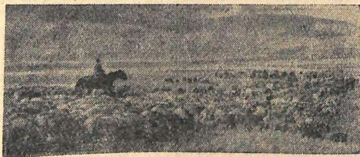
Около полумиллиона овец, табуны лошадей, стада коров пасут колхозы и совхозы Чуйской долины Киргизской ССР на пастбище Сусамыр.