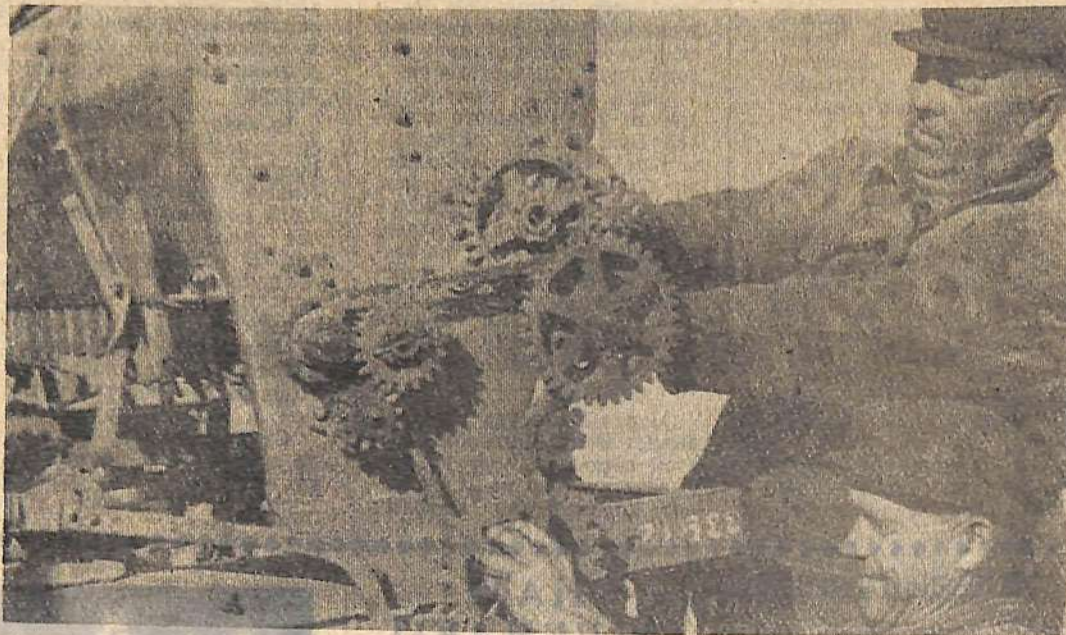
Механизаторы колхоза «Знамя коммунизма» спешат до наступления осенних холодов завершить ремонт посевной техники.