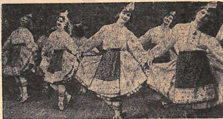
ТАЛЛИН. Дворец культуры имени Я. Томпа. На снимке: женский ансамбль народного танца «Куллакетрайд» репетирует «Танец молодых рыбацек».

Н. ГОРЧЕНИНА, мастер павильона № 5 комбината бытового обслуживания.