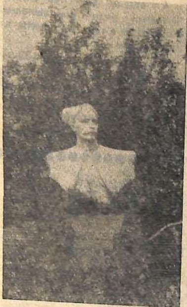
Бюст во дворе филиала Дома-музея В. И. Чапаева в Балакове.

В результате большевистской агитации 138 полк отказывается выступить на фронт. Солдаты меняют старый командный состав и избирают В. И. Чапаева командиром полка. «Много довелось мне хлебнуть солдатского горя за войну, — говорил тогда Василий Иванович, беседуя с солдатами или выступая на митингах, — не раз глядел смерти в глаза. Много всяких ораторов наслушался от всяких партий: кто большевиков хвалил, кто эсеров, кто кадетов. В голове, как в котле, а разобраться надо. Надо куда-то себя определить, нельзя в стороне стоять. Стал вспоминать всю свою