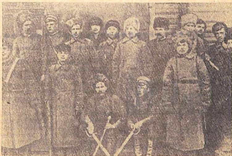
Фотодокументы из истории Великого Октября. Красногвардейский отряд Обуховского завода. Петроград, октябрь, 1917 г. Эти люди приняли участие в вооруженном восстании, в борьбе за власть Советов.