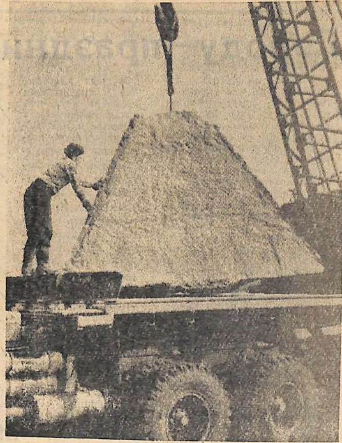
Вот они громадины—десятитонные железобетонные тетраэдры. Они первыми лягут на дно Волги поперек ее старого русла, остановят ее течение.

Скоро настанет этот час. А пока готовятся к этому водители, механизаторы, гидромонтажники, бульдозеристы, дорожники. Готовятся представители всех родов «войск». Волгу ведь в одиночку не покорить.