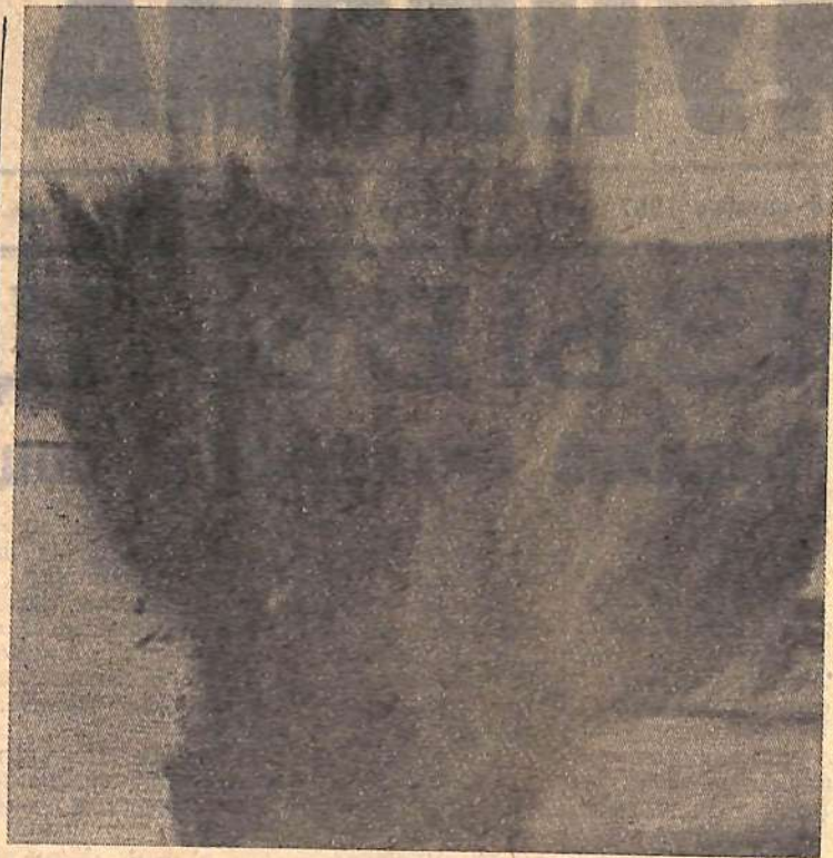
Взрыв (снимок сверху). Вода пошла в котлован (снимок внизу).