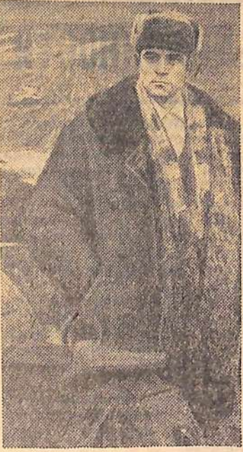
Москва. В Центральном выставочном зале открыта третья республиканская художественная выставка «Советская Россия».