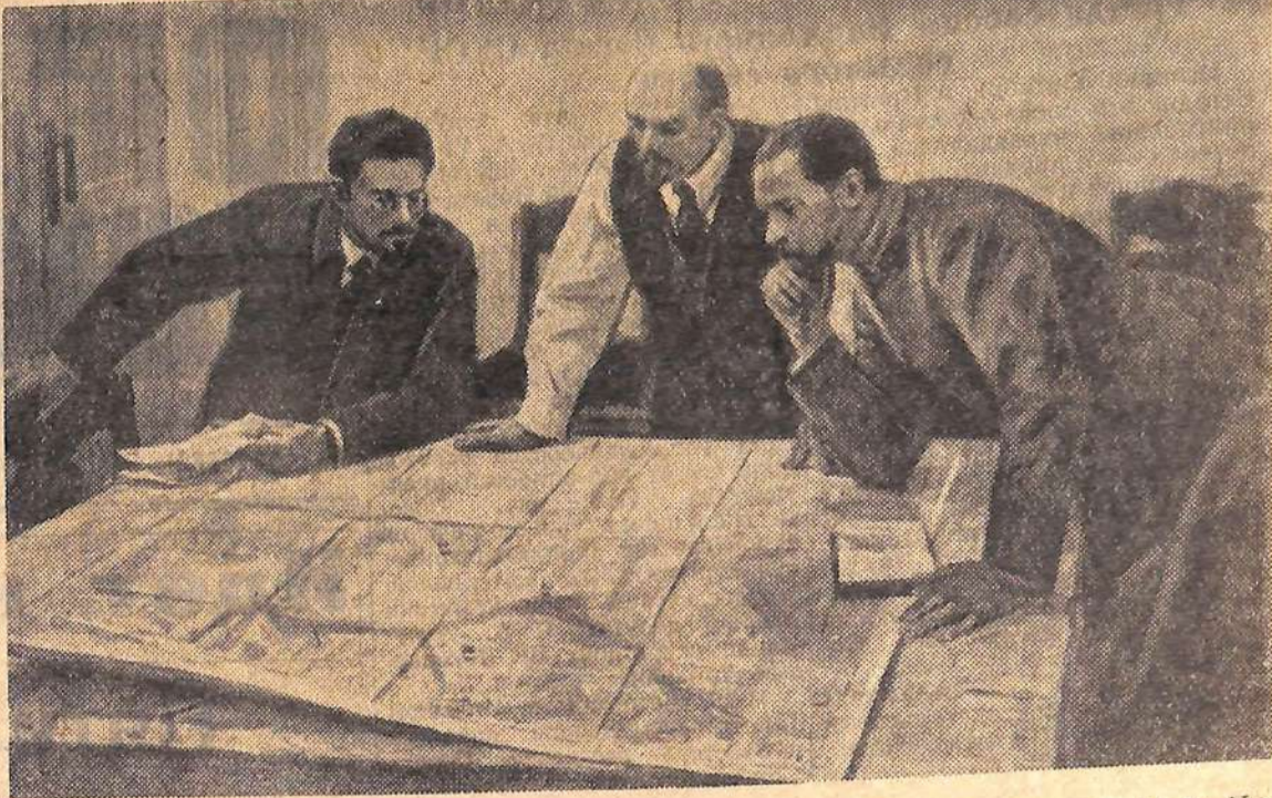
Москва, В Центральном выставочном зале открыта третья республиканская художественная выставка «Советская Россия».

На снимке: работа художника В. В. Пиненова «Перед штурмом».