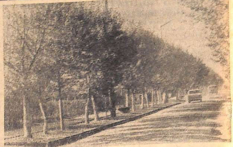
Уголок Балакова. Улица имени Академика Жук — один из зеленых уголков нашего города.