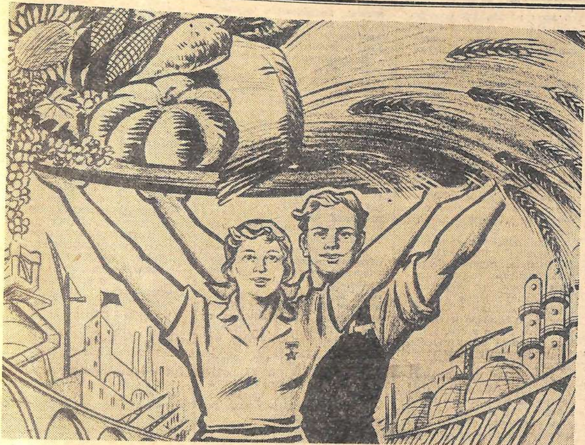
Плакат Ю. Иванова.