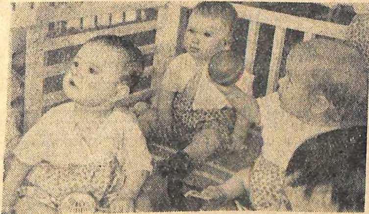
У самых маленьких.