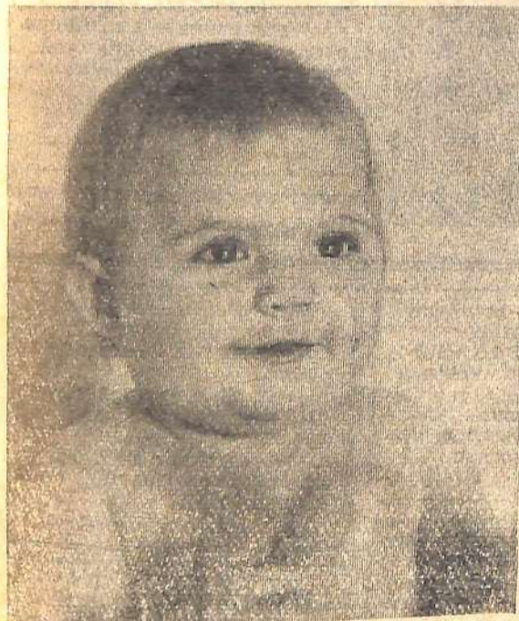
Светланке жить при коммунизме.