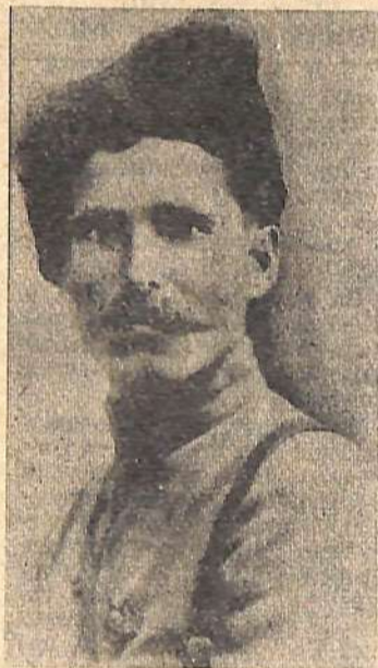
Наш земляк, Герой гражданской войны В. И. Чапаев.

К. ПАНТЕЛЕЕВ, пенсионер член КПСС с 1926 г.