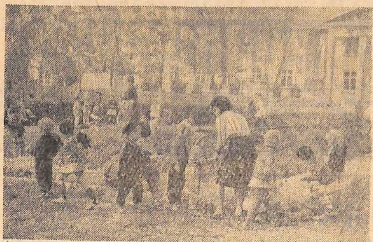
Излюбленным местом для прогулок детвора дetsада № 12 является сквер около клуба гидростроителей.