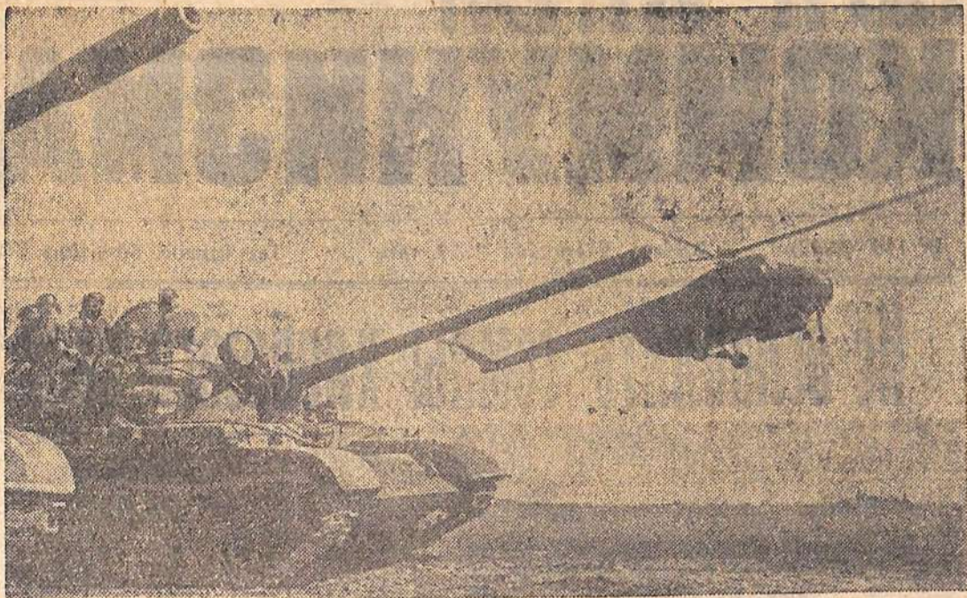
Танки с десантом идут в атаку.