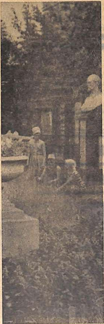
Один из уголков завода имени Дзержинского.

Большая часть работ выпала на долю коллектива стройуправления № 8 Саратовгэсстроя. План первого полугодия выполнен на 124 процента, реализован и июльский план. Есть у гидростроителей уверенность в выполнении августовского задания. Кроме основных работ по сооружению ГЭС, управлению дано задание по строительству трех насосных станций для орошения земель по берегам Большого Иргиза и Малого Узенья. Две станции построены и уже сданы под монтаж, скоро будет готова и третья.