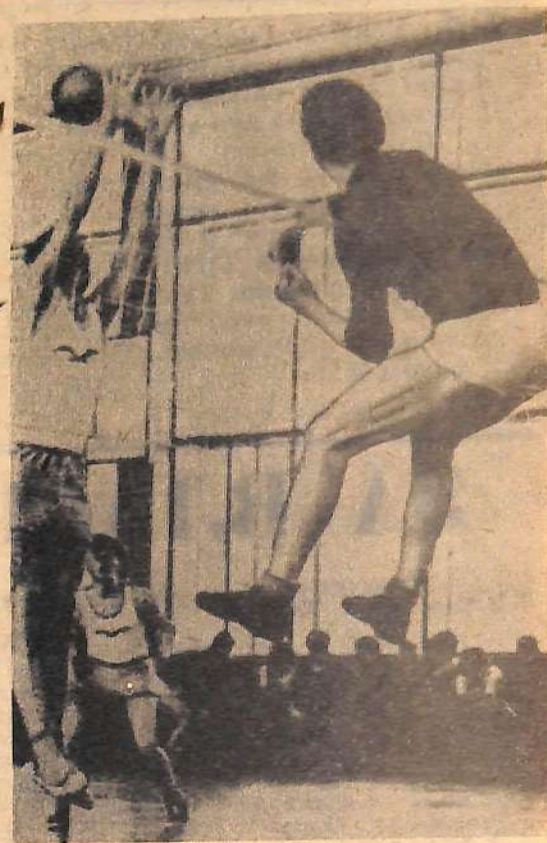
«Блок» не помог. Мощный удар приносит победу очко.