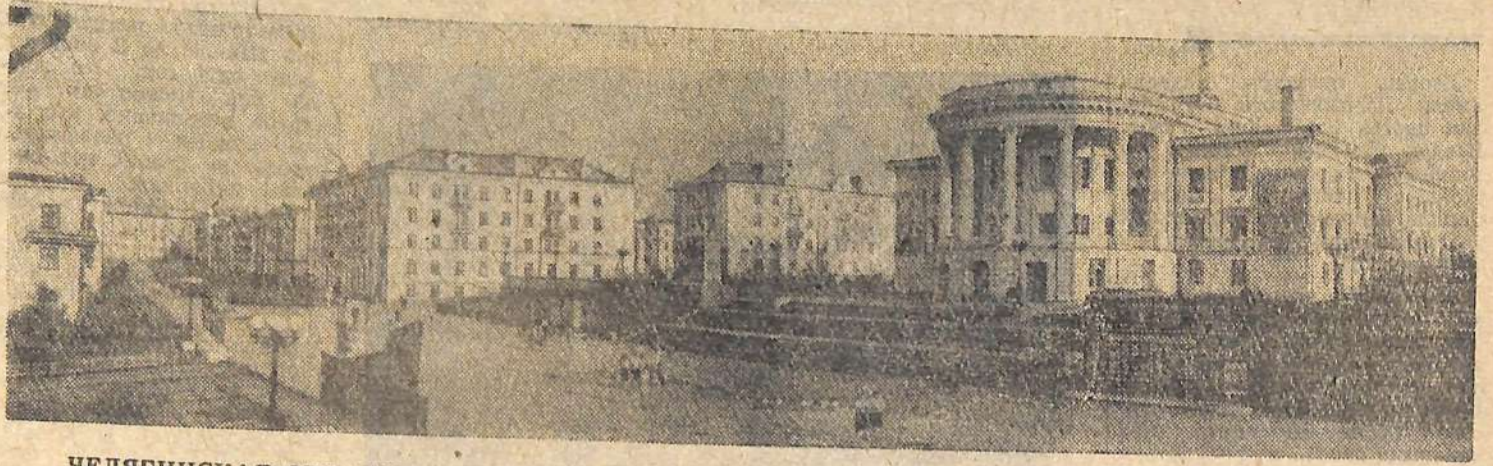
ЧЕЛЯБИНСКАЯ ОБЛАСТЬ. Город Сатка. За последние годы для рабочих завода «Магnezит» и для строителей здесь возведено большое количество благоу-

Обслуживанием населения занято около 22 миллионов человек, каждый четвертый работник народного хозяйства. В перспективе в этой сфере будет занята примерно треть всех работающих. Сегодня индустрия удобств оказывает населению около 400 различного вида услуг.