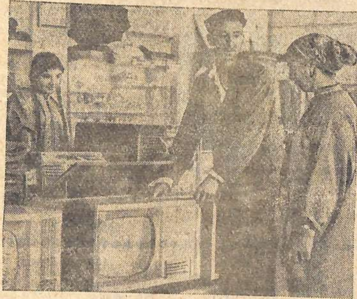
ТУРКМЕНСКАЯ ССР. В универсаме колхоза «Мир» Ашхабадского района.