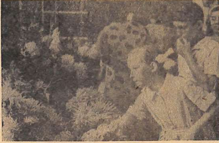
Выставка цветов во Дворце культуры завода имени Дзержинского.

Комбинат химического волокна представил на выставку цветы, растущие на территории предприятия: розы, канны, все-