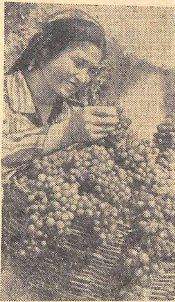
Перед новым учебным годом