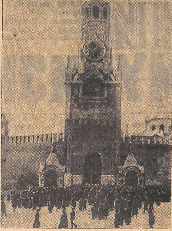
Фото документы из истории революционных солдат. (Справа): Москва, ноябрь 1917 года. Кремлевские куранты со следами повреждений после обстрела в дни октябрьских боёв 1917 года.