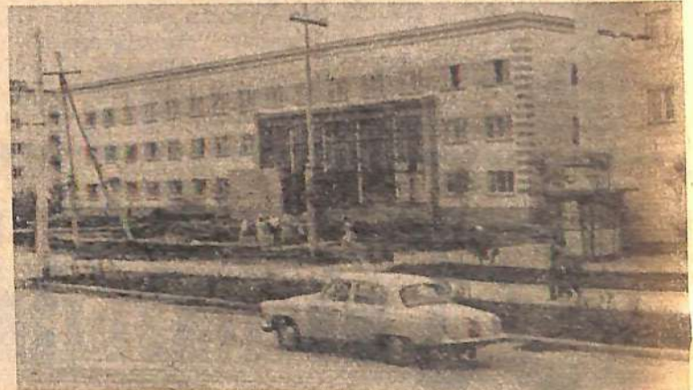
В третьем микрорайоне отделяется новое здание почтамта. На снимке: последние работы по благоустройству у почтамта.