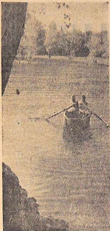
На Иргизе в летний день.

В 1914 году по всей России было всего 270 детских садов, которые посещали 7 тысяч детей. Сейчас в нашей стране в детсадах и яслях восемь с половиной миллионов малышей. Разве эта цифра не говорит о счастливом детстве!