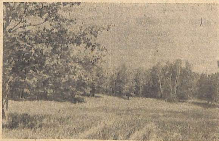
Лето на Калинках — в окрестностях колхоза имени Свердлова.