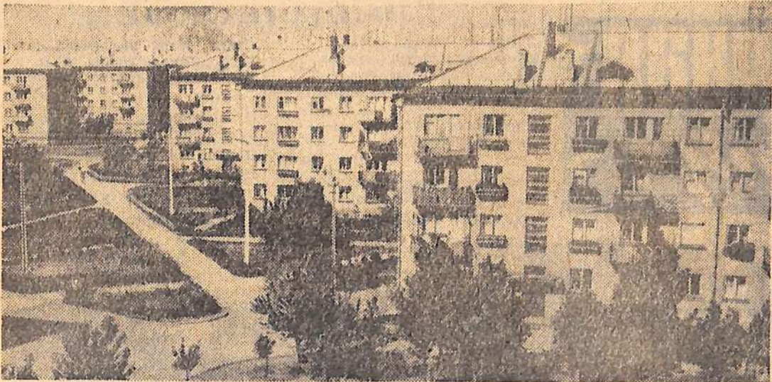
Уголок Балакова. Улица Титова.