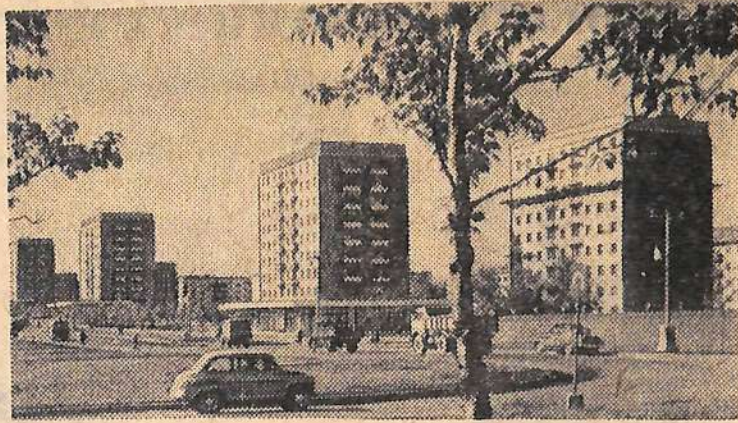
Улица Восточная в Свердловске — одна из старейших в городе. За последние годы она изменилась до неузнаваемости, строители возводят здесь благоустроенные многоэтажные жилые дома. На снимке: улица Восточная в Свердловске.

12-00—Теленовости, 12-10—«Подвиг», Телеальманах, 13-00—Спартакиада народов СССР. Баскетбол, 15-20—На Всесоюзной X спартакиаде школьников, посвященной 50-летию Великого Октября, 18-30—Для школьников. «Мы будем рисовать», 19-00—«Будни бригады», Передача для работников сельского хозяйства, 19-15—«Героический путь борьбы и созидания». Тезисы ЦК КПСС к 50-летию Советской власти, 19-30—Спектакль Московского Академического театра имени Маяковского. В антрактах—Земля Саратовская. Дневник полевых работ.