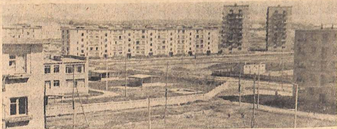
В ансамбле города — девятиэтажные.

Обращаться в отдел кадров Волжского СУ. Проезд автобусом № 5 до остановки «ДОЗ». Телефон 34-55 4-3.