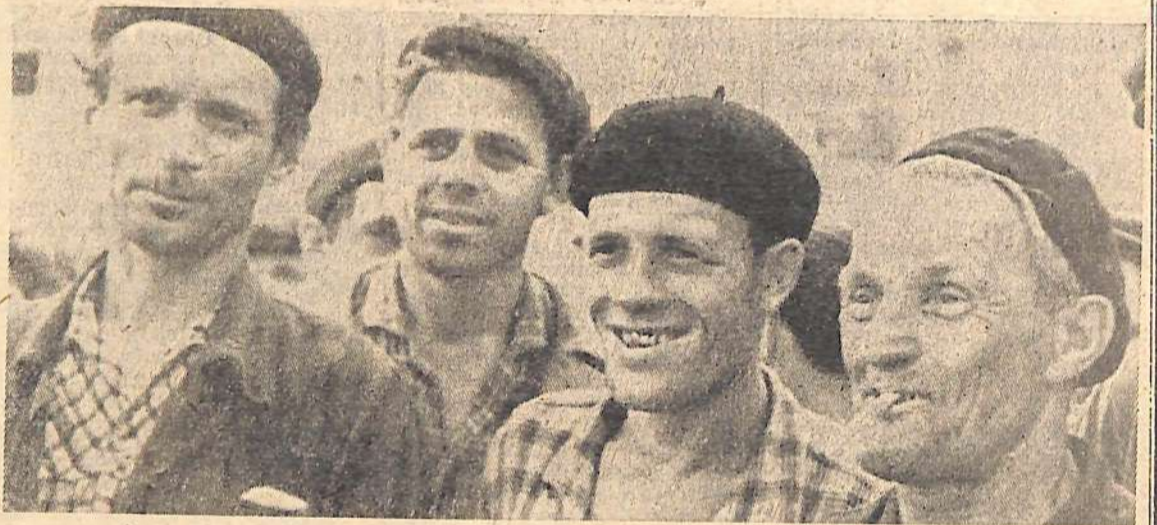
Строители седьмой Волжской.

В торжественной обстановке будет заложен фундамент обелиска комсомольцам и молодежи — участникам строительства Саратовской ГЭС.