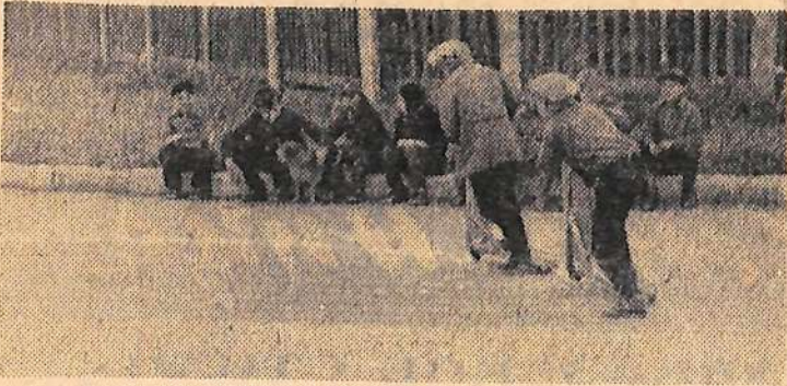
«У них свои мотогонки».