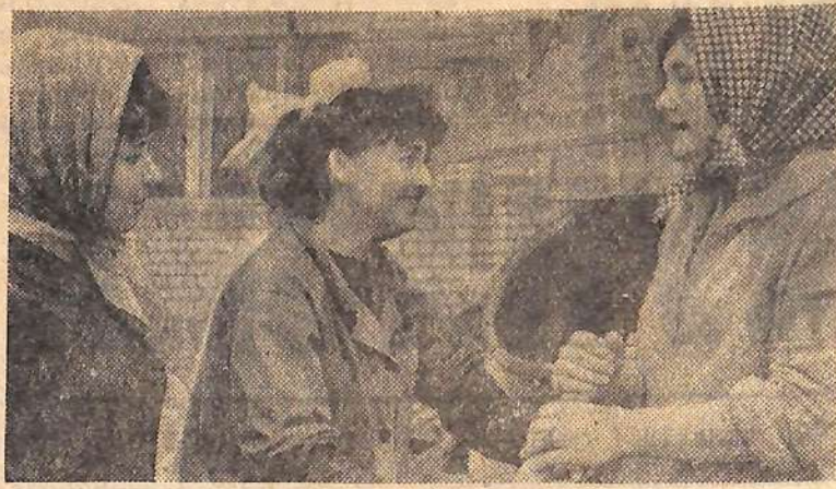
Добрая слава идет о выпускниках школы № 38. По окончании школы одни из них поступают в институты, техникумы, другие — идут на комбинат химического волокна, на строительство Саратовской ГЭС, где работают и учатся заочно.

П. ГОЛУБЕВ, начальник отдела кадров СУ-6.