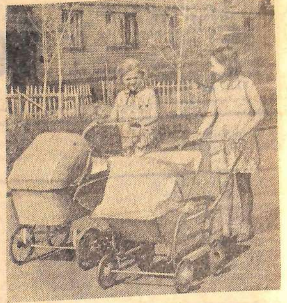
У подружек — братишки.