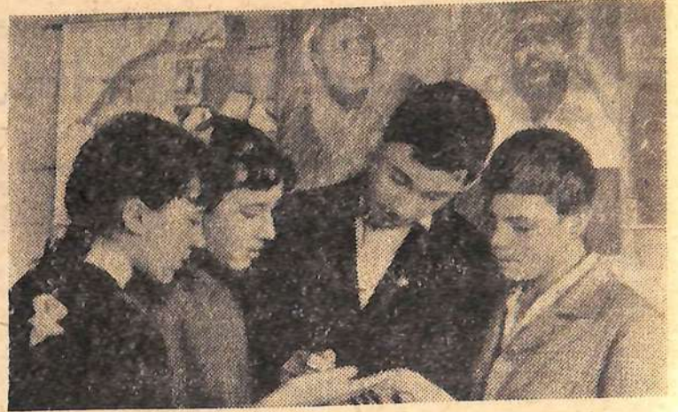
Уже не один год работает детский кинотеатр «Спутник» при кинотеатре «Космос». Учащиеся средней школы № 38 здесь хозяева.