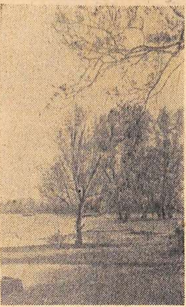
Родная природа.