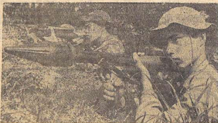
ЮЖНЫЙ ВЬЕТНАМ. Бойцы Армии освобождения на огневой позиции.

ных на кооперативных предприятиях. За последние семь лет в системе Центросоюза построено 143 консервных завода, 587 миллионов банок консервов получило население страны только за один год. Кстати, в павильоне можно и ознакомиться с этой продукцией, 1500 образцов консервов — переработанных плодов, овощей, ягод, а также соков в бутылках, банках, тубиках — яркими, словно собранными из разноцветной мозаики, рядами выстроились в одном из залов. А по соседству — чудесная меховая коллекция: десятки шкуроч самых разнообразных пушных зверей — обитателей леса и звероводческих ферм.