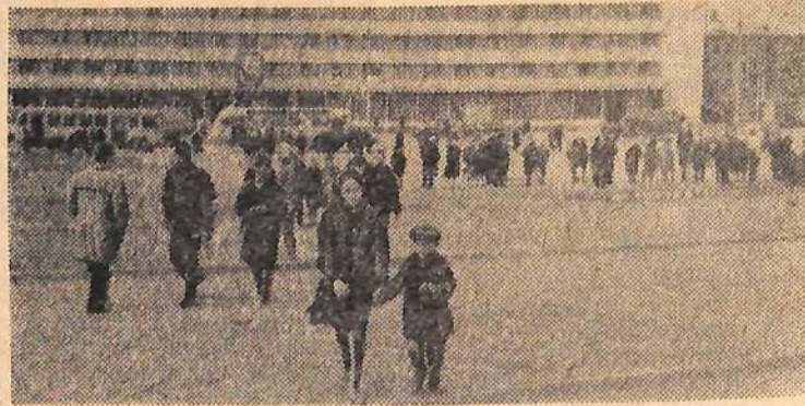
Многолюдной стала площадь в районе гостиницы «Чайка» и универсама «Ромашка».

Зарубежные фильмы: «В джазе только девушки» (США), «Невеста Бубе» (Франция), «Другая сторона медали» (Югославия).